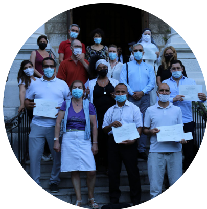
Remise diplômes 2020-2021

Formation continue : 800 € selon situation individuelle et financement employeur ou autre organisme